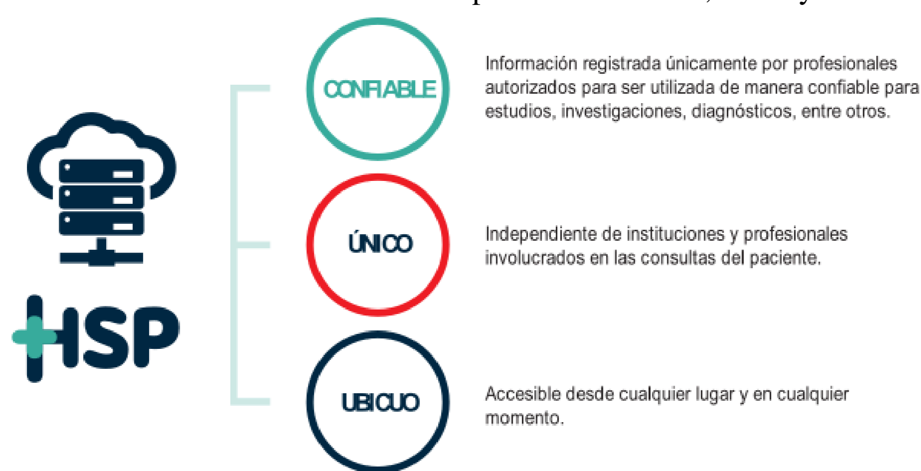
Figura 1: Características del sistema HSP.

El Proyecto HSP busca mejorar la organización y el acceso al historial de salud de pacientes en el Paraguay a través de un sistema de historial de salud personal confiable, único y ubicuo (ver Figura 1).