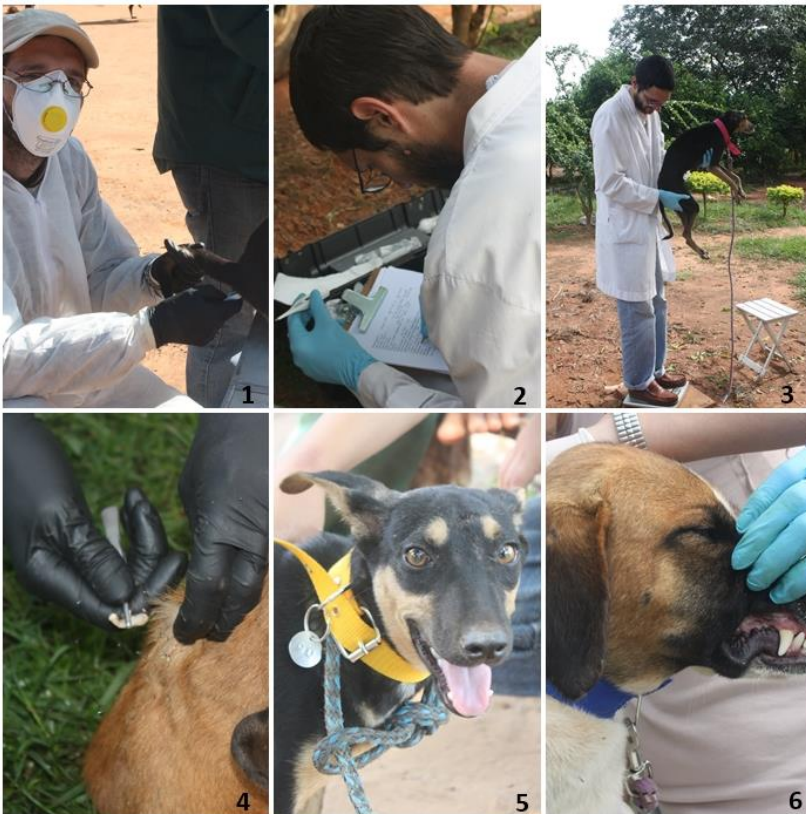
Figura 3: 1. Control de T° rectal, 2. Ficha clínica, 3. Registro de peso corporal, 4. Miasis 5. Collar numerado, 6. Revisión de encías.

En las zonas de muestreo existen antecedentes de Leishmaniasis y durante los exámenes clínicos se encontraron perros con síntomas presuntivos de la enfermedad, como alopecias, escoriaciones, úlceras, costras, agrandamiento de ganglios, mala condición corporal, onicogriposis entre otros. Algunos de los animales examinados presentaban síntomas presuntivos de parasitismos del tracto gastrointestinal, como pelo hirsuto, mucosas y conjuntivas pálidas, materia fecal con sangre, diarrea, mala condición corporal, y respondieron favorablemente al tratamiento antiparasitario.