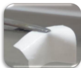
Figura 1: Forma farmacéutica de sistema de administración transdérmica de fármacos (STT) de uso tópico.

El enfoque biotecnológico-farmacéutico aporta el desarrollo de un medicamento biológico, específicamente un sistema de administración transdérmica de liberación controlada con características de calidad, seguridad y eficacia que ofrece un tratamiento integral, de concepción y elaboración regional. Dirigido al paciente que padece de úlceras, desarrollado a escala laboratorio bajo principios de producción más limpia (P+L) y química verde, para contribuir en el aporte de productos amigables con el ambiente de nuestra región. De este modo, se aporta un tratamiento más accesible, específico, permitiendo que el paciente permanezca ambulante durante su tratamiento y así, mejorar su calidad de vida.