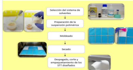
Figura 3: Etapas del proceso de elaboración del sistema de administración transdérmica de fármacos (STT).

Desarrollo de un medicamento biológico de uso tópico para elevado volumen de exudado.