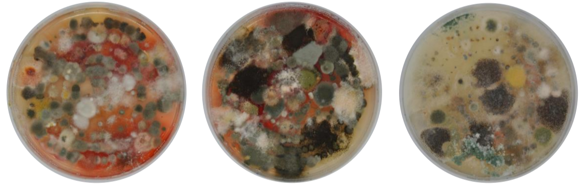
Figura 1: Fotografías correspondientes a los cinco días de crecimiento.

Monitorear la calidad del aire de una cocina metabólica dietética a través del análisis microbiológico de los hongos presentes en el ambiente