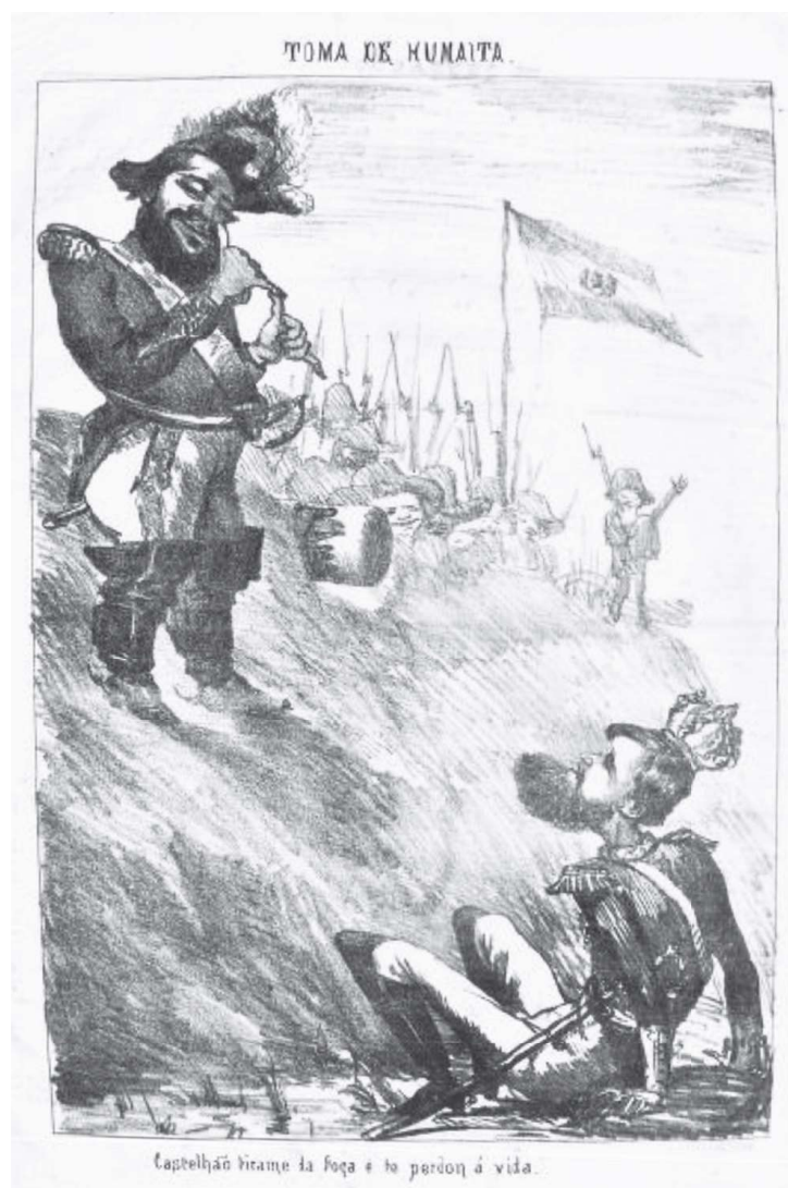
Imagen 1: Caricatura alusiva a la Campaña de Humaitá.

En los momentos finales de la Campaña de Humaitá que se extendió por más de dos años, desde el 16 de abril de 1866 al 05 de agosto de 1868, al parecer El Chubasco dudaba si llegaría a producirse una victoria de los ejércitos aliados o si finalmente las fuerzas al mando del Mariscal Francisco Solano López resistirían el ataque e impedirían una invasión a territorio paraguayo. Dudaba o en realidad ironizaba al respecto.