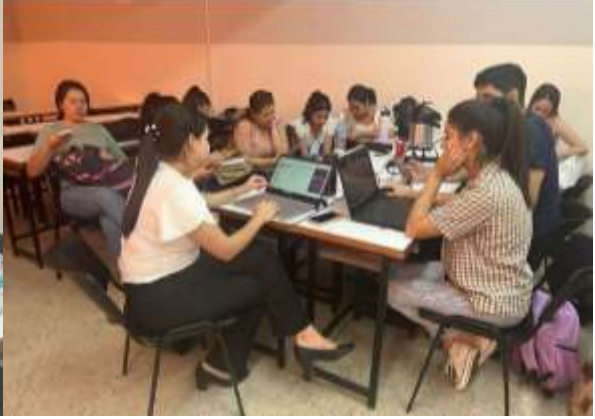
MESAS DE TRABAJO