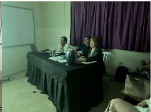
MESA DE JURADO