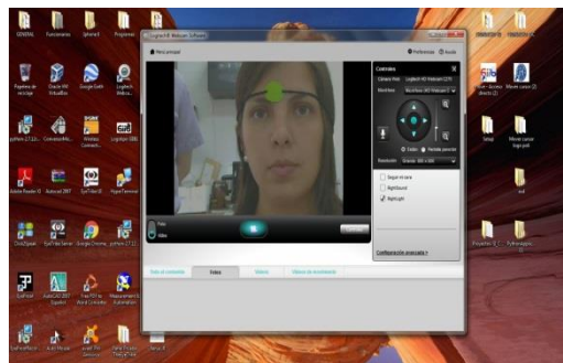
Fig. 1 Software de rastreo de patrones para controlar el cursor

Se logró desarrollar un software que utiliza el reconocimiento de patrones para poder realizar el control del cursor del mouse así como se consiguió desarrollar un software por comando de voz de que permite el control de las principales funciones del mouse. Con estos resultados se espera realizar oportunamente las pruebas en pacientes para poder recabar los datos de las mejoras que podrían realizarse al desarrollo. Esto nos permitirá alcanzar el objetivo principal del proyecto el cual es desarrollar un software que permita a los pacientes con cuadriplejía controlar el computador.