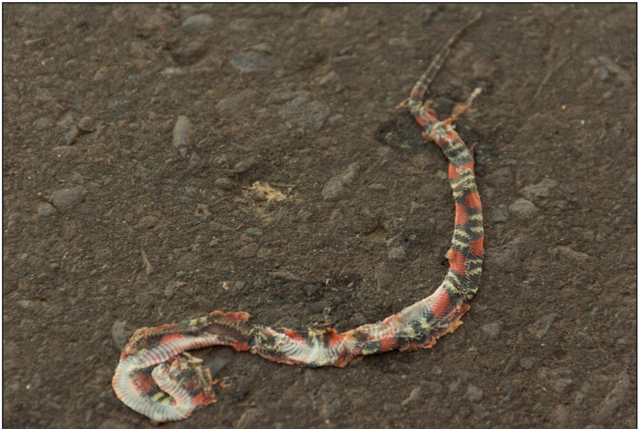
Figura 1. Ejemplar de Oxyrhopus guibei atropellado en la ruta nacional N° 9 Dr. Carlos Antonio López (Transchaco), Paraguay.

Comentarios — El género Oxyrhopus se encuentra representado en Paraguay por tres especies, O. guibei , O. petolarius y O. rhombifer (Cacciali et al. , 2016). O. guibei es una serpiente terrestre de hábitos nocturnos (Sazima y Abe, 1991) de porte mediano de la familia Dipsadidae (Xenodontinae: Pseudoboini), conocida comúnmente como falsa coral por presentar coloración y patrones que varían entre negro, rojo y blanco, al igual que las serpientes del género Micrurus o corales verdaderas. Su alimentación se basa principalmente en roedores y lagartos pequeños, y