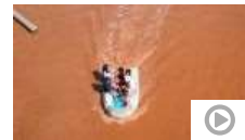
Las fuertes lluvias de la Dana ponen en alerta a siete comunidades