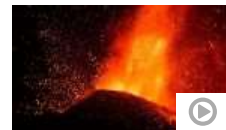
Rompe el cono por la parte suroeste y deja "una colada enorme"