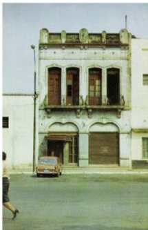
Vivienda típica del centro de Asunción de finales del siglo XIX e inicios del siglo XX.