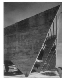
Colegio Experimental Paraguay-Brasil de Asunción. Proyecto de 1952 de Afonso Eduardo Reidy. Arriba: Fachada sur; Abajo: Fachada norte del mismo edificio.