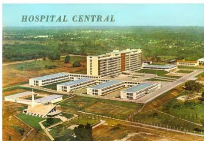
Hospital Central del IPS, 1969. Asunción.