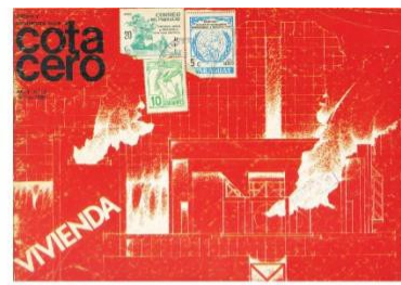
Año 4, Num. 13, Abril 1986