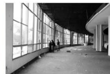
Hotel Casino San Bernardino, 1974. Arquitecto Arturo Herreos. Obra del Instituto de Prevision Social.