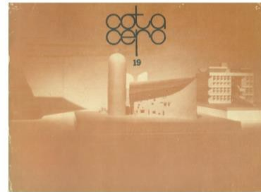
Año 5, Num. 19, 1986