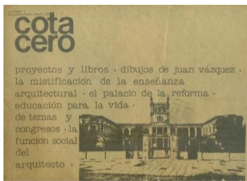
Año 1, Num. 0, 1983