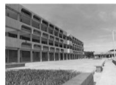
Colegio Goethe de Asunción, 1978. Arquitecto Kurt Ernesto Tipach