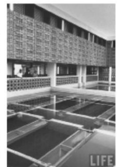
Edificio sede de la Corporación de Obras Sanitarias de Asunción COR-POSANA, aproximadamente hacia 1957. Obra de la empresa americana Kaiser Engineers International.