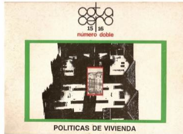
Año 4, Num. 15-16, Nov-Dic 1986