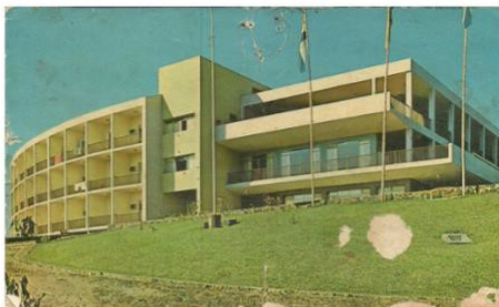
Hotel Casino de Acaray, 1965. Arquitecto Arturo Herreros, Ciudad de Puerto Pdte. Stroessner. Fue uno de los primeros edificios construidos en la nueva capital del este del País.