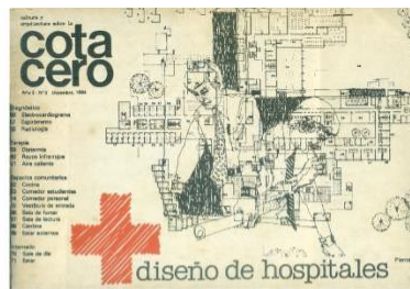
Año 2, Num. 8, Diciembre 1984