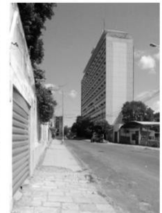
Edificio sede en el centro de Asunción del Instituto de Prevision Social. Aprox. 1959. Homero Duarte y Jose Luis Escobar