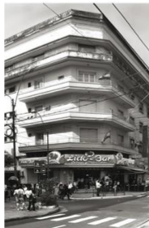
Edificio Franede en el centro de Asunción, 1950. Obra de Francisco Canese.