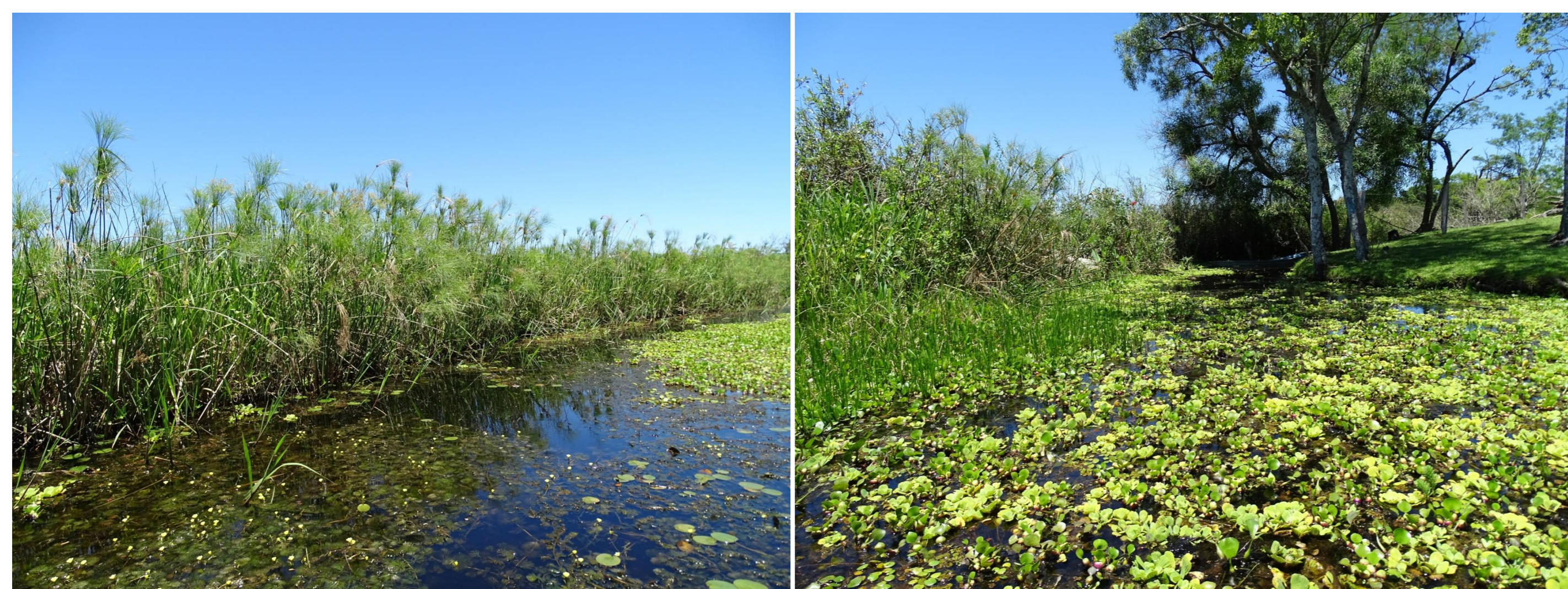
Figura 2. Humedales del Complejo Ypoá.