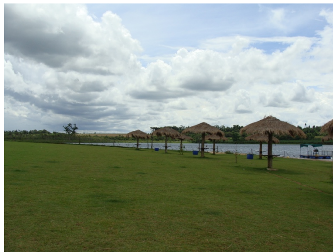
Figura 10. Parque Asahi en Yguasú.

Este municipio cuenta con una oficina de turismo y recibe apoyo del gobierno japonés por lo cual posee una buena infraestructura turística, como los parques Ito , Asahi (Fig. 10) y Pikypo (Fig. 11), y el Museo del Inmigrante . Se realizan varios acontecimientos programados anualmente: Expo Yguazú Pora , Feria Agropecuaria Innovar , Fiesta Nacional del Rally , Natsubon (festival de verano japonés). En los ríos Monday e Yguazú se practica la pesca deportiva. De la represa del río Yguazú se ve el Gran Lago y las reservas forestales de la ANDE.