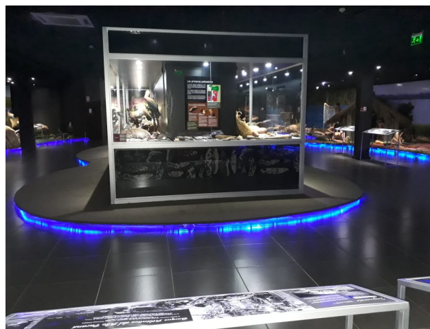
Figura 16. Espacio de Itaipú que muestra la evolución histórica de la región.

También en el distrito Hernandarias se encuentra la reserva biológica Itabo , perteneciente a la entidad Itaipu, así como la represa hidroeléctrica Acaray que también se puede visitar.