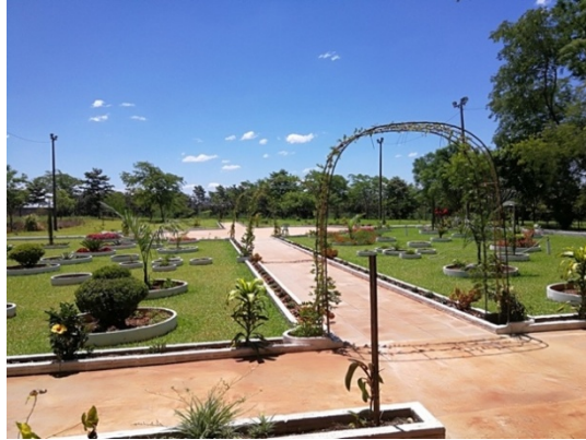
Figura 3. Vista de la Plaza Jardín en el Parque Petter en Santa Rita.

El Parque Petter de Santa Rita cuenta con atractivos naturales, bungalós, piscina y un pequeño zoológico.