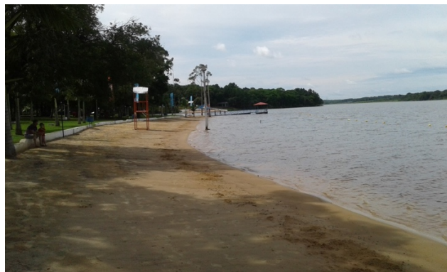
Figura 8. Club Náutico Nativa en Juan E. O'Leary.

Este Municipio cuenta con importantes atractivos turísticos como el Club Náutico Nativa (Fig. 8) y el Club Náutico Tacuaro , además de tallados artísticos en la Parroquia San Antonio de Padua (Fig. 9). Tiene acceso por ruta asfaltada, relativamente buena oferta hotelera, y balnearios sobre el Lago Yguazú , ideal para turismo interno. Carece de Secretaría o Departamento de apoyo al turismo, la promoción al turismo es escasa y hay déficit de señalización vial. Se encuentra a 73 km al oeste de Ciudad del Este y a 250 km de Asunción.