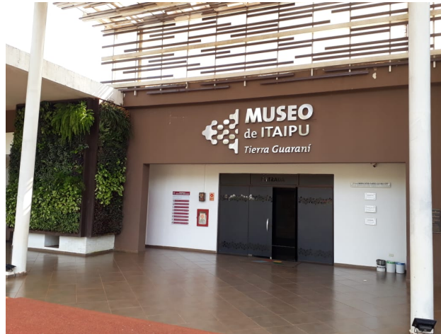
Figura 15. Museo de Itaipú Tierra Guarani.

El museo de la tierra Guarani (Fig. 15), que se encuentra en el municipio, es un sitio mantenido por la Itaipu y cuenta con importantes atractivos que están habilitados para que el público pueda visitarlos. Alberga una recopilación histórica de los años de ocupación y cultura de los habitantes indígenas y pobladores en general, incluyendo los animales silvestres que habitaban la región.