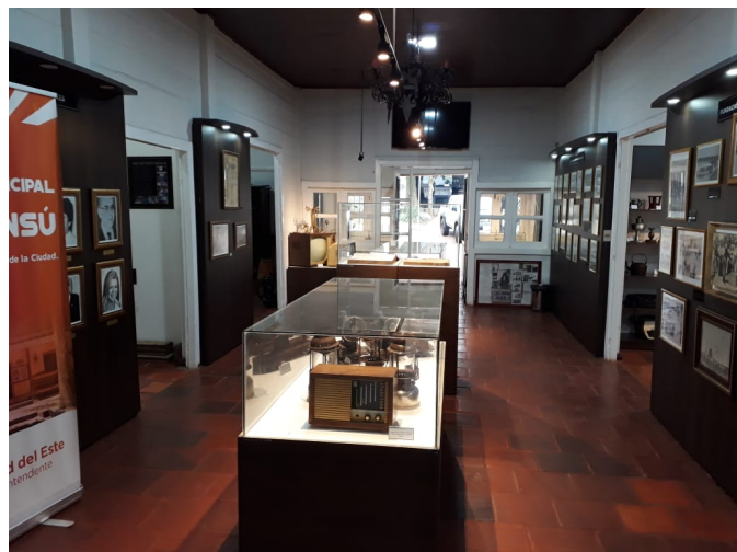
Figura 12. Visita al Museo El Mensú.

El Museo El Mensú (Fig. 12) está ubicado en el predio de la Municipalidad de la ciudad. En este museo están guardados objetos históricos de Ciudad del Este, testimonios de los primeros años del municipio.