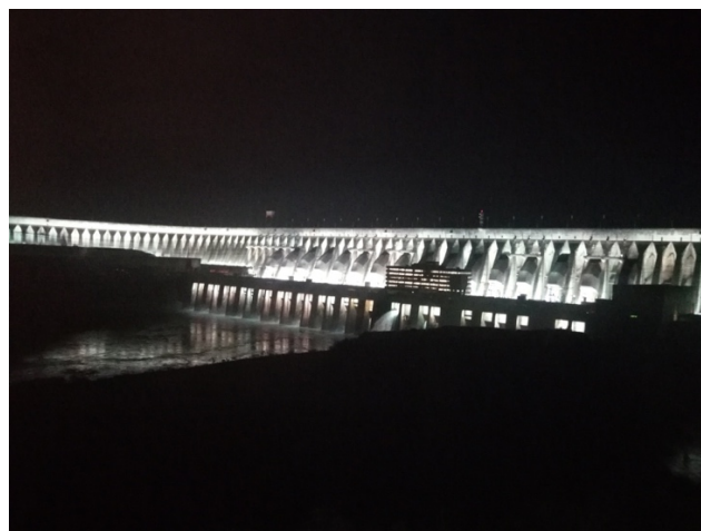
Figura 14. Iluminación de la Represa Itaipu.

Esta ciudad se encuentra a 8 km hacia el norte de Ciudad del Este y a 335 km de Asunción, fundada en 1896, es la ciudad más antigua de Alto Paraná. La usina hidroeléctrica Itaipu se encuentra en el municipio de Hernandarias. Un espectáculo turístico constituye la iluminación de la represa (Fig. 14), que posibilita admirar el resplandor de la hidroeléctrica cuando se iluminan las obras civiles en forma sincronizada para poder apreciar mejor la presa. Al mismo tiempo, se brindan explicaciones de detalles sobre la gran usina de Itaipu, que es la mayor productora de energía hidroeléctrica del mundo. Esta represa forma un gran lago artificial con paisaje majestuoso donde se puede hacer paseo en lancha.