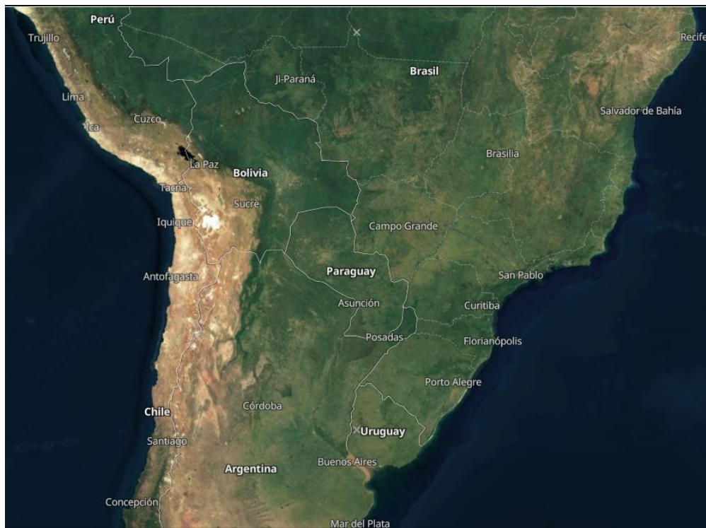
Figura 1. Ubicación geográfica de Paraguay (Maps, 2019).