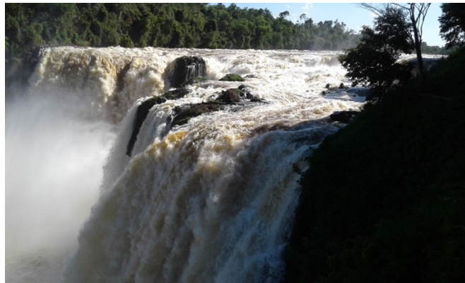
Figura 5. Salto del Monday.

Una visita obligada cuando se recorre el municipio de Presidente Franco, es el museo Moisés Bertoni (Fig. 6), que era la casa del sabio suizo Moisés Santiago Bertoni, quien se afincó en el año 1894 y permaneció allí hasta su fallecimiento en el año 1929, dejando una invaluable herencia de conocimientos y enseñanzas.