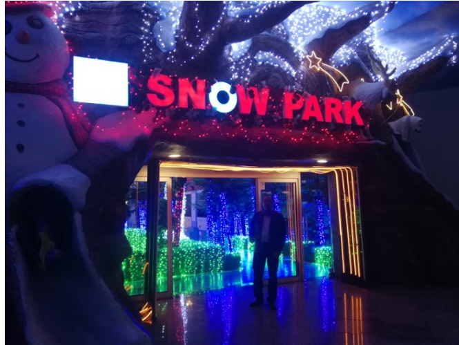
Figura 13. Snow Park en el Shopping París.

El Snow Park (Fig. 13) está ubicado en el Shopping París de Ciudad del Este y es un lugar que las personas que gustan esquiar o realizar piruetas sobre hielo, pueden visitar. La gente visita estos sitios para poder realizar sus fantasías sobre el hielo.