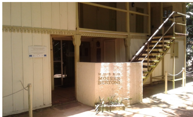
Figura 6. Museo Moisés Bertoni.

Una visita obligada cuando se recorre el municipio de Presidente Franco, es el museo Moisés Bertoni (Fig. 6), que era la casa del sabio suizo Moisés Santiago Bertoni, quien se afincó en el año 1894 y permaneció allí hasta su fallecimiento en el año 1929, dejando una invaluable herencia de conocimientos y enseñanzas.