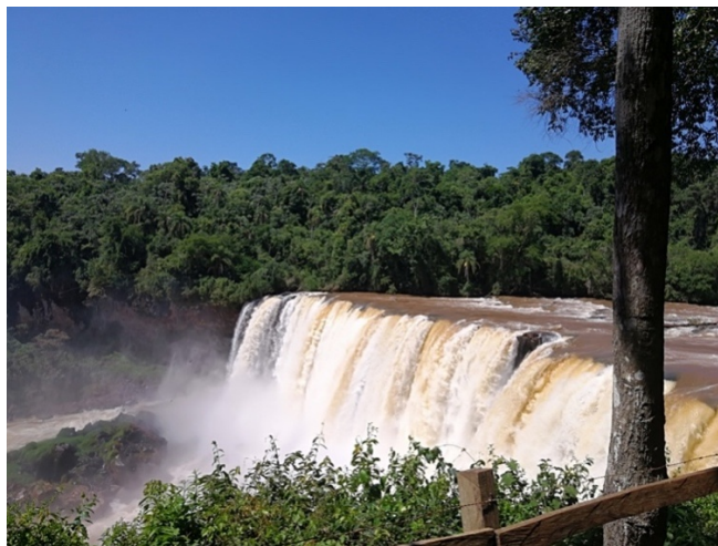
Figura 4. Salto del Ñacunday.

Es un municipio con necesidades de servicios e infraestructura, actualmente carece de condiciones para el turismo receptivo, siendo una de estas carencias la buena accesibilidad. Se encuentra a 68 km de Ciudad del Este y a 394 km de Asunción, al sur del Departamento. En este municipio se encuentra uno de los mayores potenciales turístico que es el Salto Ñacunday . El Parque Nacional Ñacunday (Fig. 4) constituye una de las bellezas naturales más impactantes, a pesar del estado y la falta de señalización del Parque, este lugar es visitado por unas 5000 personas al año.