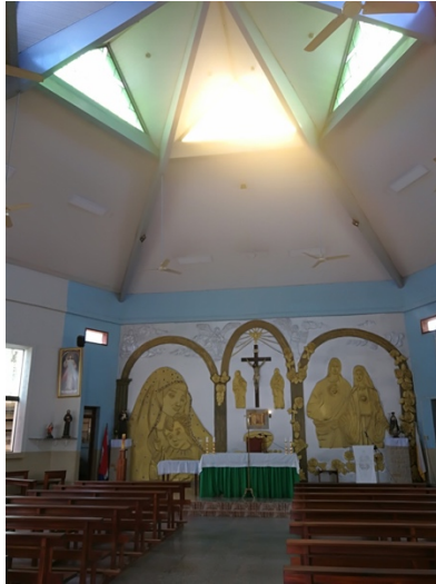
Figura 9. Parroquia San Antonio de Padua con tallados artísticos.