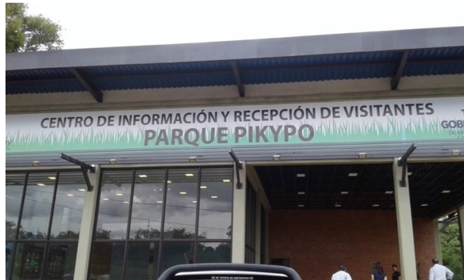
Figura 11. Parque Pikypo en Yguasú.

El 1° de mayo, fiesta de San José Obrero, se realizan los festejos patronales con ferias de comida y festivales de música para apreciar las expresiones artísticas de los japoneses y también de los paraguayos.