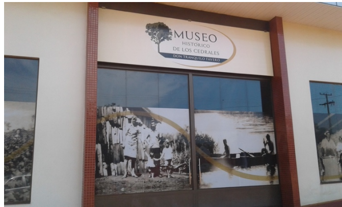
Figura 7. Museo Tranquilo Favero.