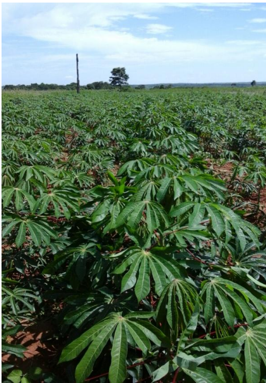
Figura 8. Vista del cultivo.