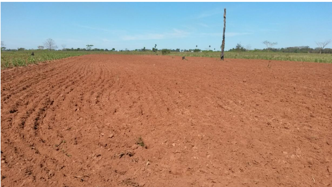
Figura 4. Vista general de la parcela posterior a la preparación del terreno.