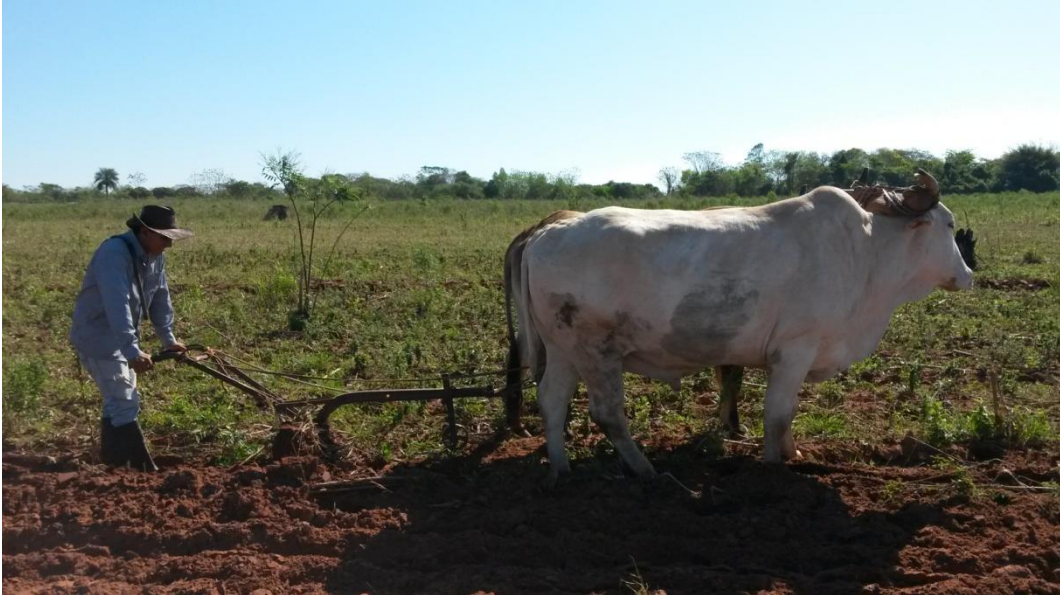
Figura 3. Preparación del terreno con arado a tracción animal.