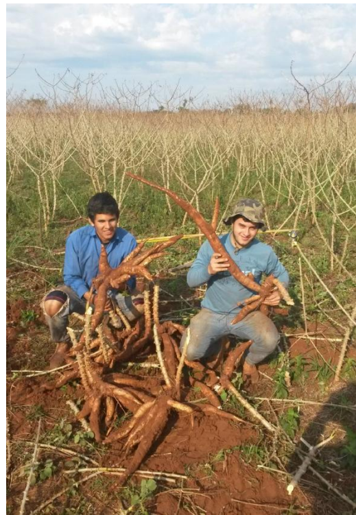
Figura 9. Cosecha manual de la mandioca.