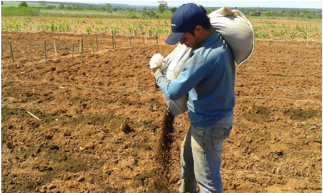
Figura 5. Aplicación de tratamientos