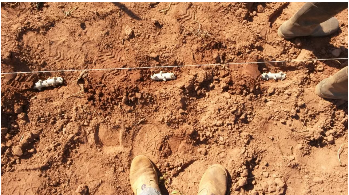
Figura 6. Plantación de las ramas semillas.