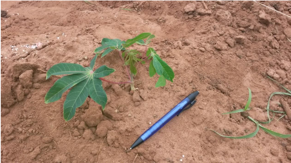
Figura 7. Planta de mandioca 30 días después de la plantación