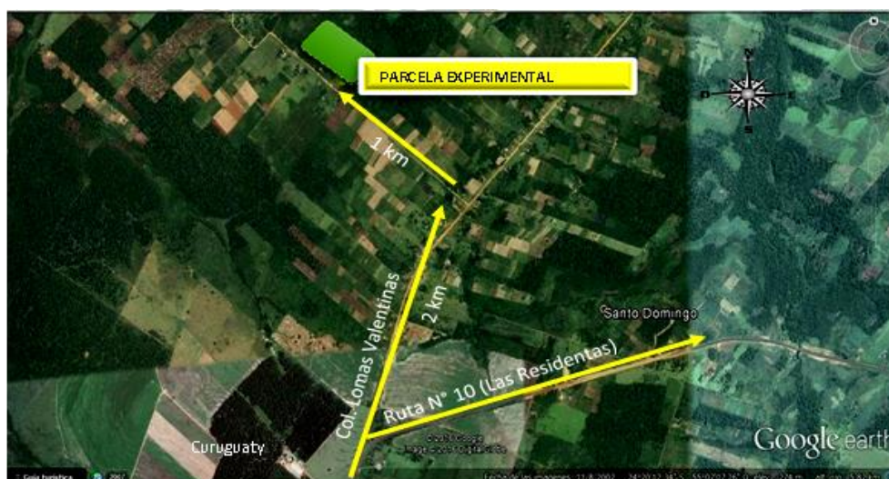
Figura 1. Imagen Satelital del local del experimento en el Dpto. de Canindeyú.

El ensayo se llevó a cabo en el Departamento de Canindeyú, distrito de Ybyrarobaná, Colonia Lomas Valentinas. Las coordenadas de ubicación de las parcelas experimentales son 24^{\circ}18'59,16''\text{S} y 55^{\circ}02'46,81''\text{O} (Figura 1).